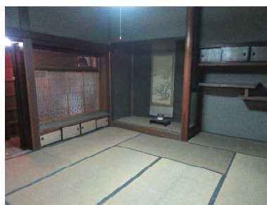
黒檀などの銘木が使用された床の間