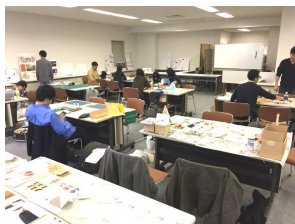
学生さんによるワークショップ