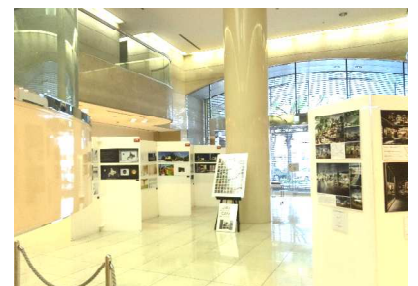
ニッセイ平和ビルにて開催されました