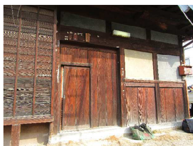
遊びココロにあふれた門扉