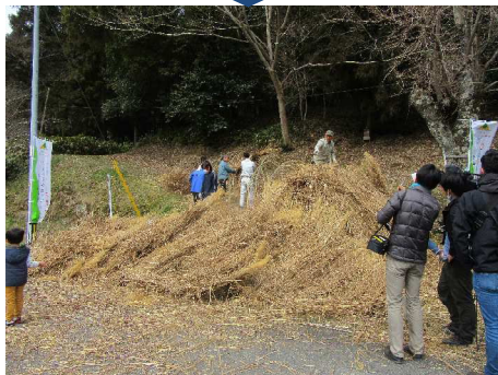
正午 全体像が見えてきました(*^^*)