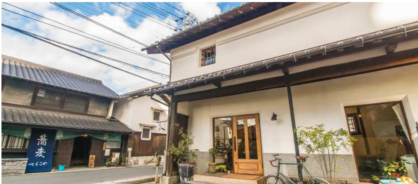
築110年の古民家を改装した「衣・食・住」をテーマにした複合古民家施設。「寺子屋しゃんてい」