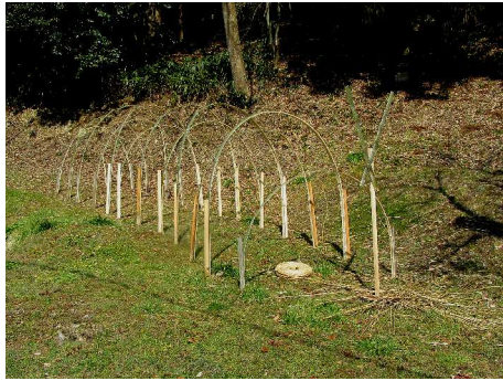
午前10時 骨組みだけの「はらぺこおおむし」