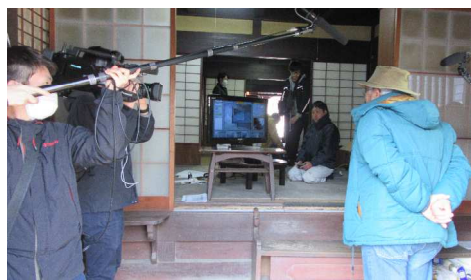
多数のマスコミが取材に来られました