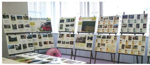
熱心にパネルを見ていただくことができました！