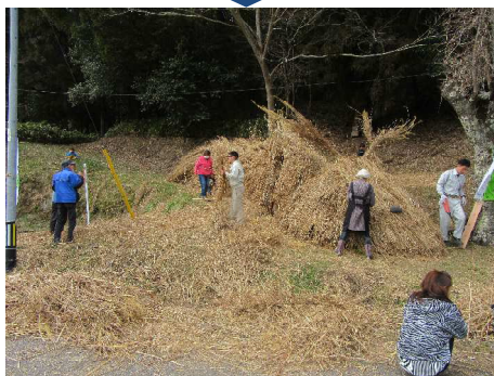
午後2時 顔や角が登場してもうすぐ完成!!