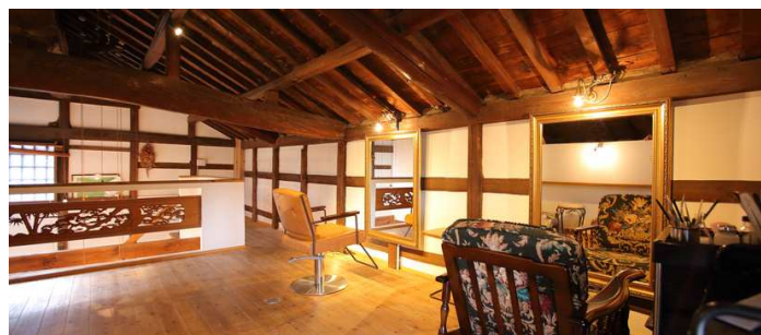
サロン2階は小屋組があらわに！重厚感あふれる空間を楽しめます。