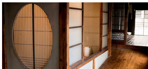
築110年の趣あふれる店内。「蕎麦てらこや」