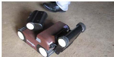
狭小空間点検ロボット「moogler（モーグル）」

道具類など随分寄贈されたそうですが、それでも民具や、古い帳簿、アルバム、漆器類、お膳など、たくさんの物が残されていて、ご近所の方と一緒に当時に思いを馳せ、楽しい時間を過ごさせていただきました。