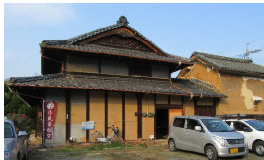
築100年以上、趣溢れる古民家です

「モーグル」は、オモチャのようなかわいい外見ですが、今後の活躍が期待できるすごいロボットでした！