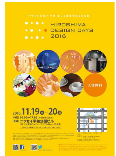
デザインを体感できる「デザインデイズ」

デザインデイズでは、毎年、沢山の大学やデザイン専門学校の生徒さんが、ワークショップ開催やコンペ出場の為に集まってこられます。