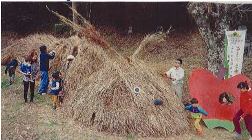
ついに完成!!! ススキで作ったオブジェ「はらぺこおおむし」

廿日市市虫所山の「大虫集落」で、耕作放棄地に生えたススキで「大きな虫（はらぺこおおむし）」のオブジェを作るイベントが開催され、私達も参加をさせていただきました、