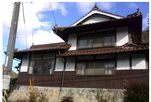
多くの自然が残る福富町の中心部に位置する

この度は、所有者様のご好意により、地元の近畿大学の先生と生徒さんによる古民家鑑定の見学もあり、日頃建築の勉強をされている方の目線を、こちらにも参考にさせて頂ける良い機会を得ました。