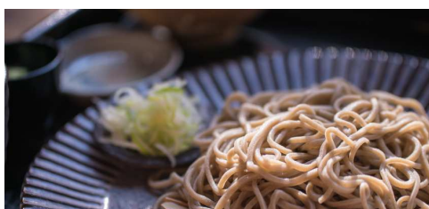
国産のそば粉のみを使用した蕎麦は絶品！！

蕎麦屋、美容院、ヨガスタジオ、お稽古教室…「身体に優しい自然のモノ」をコンセプトにライフスタイルごと提供する古民家複合施設「寺子屋しゃんてい」。