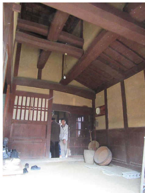
立派な小屋組をみることができました