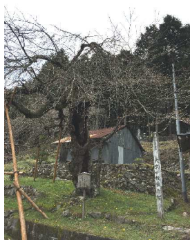
存在感のある桜の木。