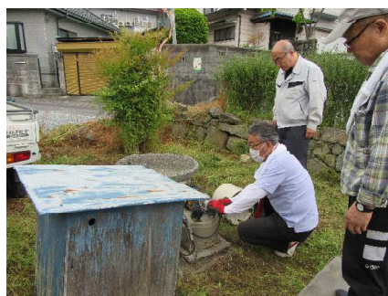
井戸は使えるか…息をのんで見守ります