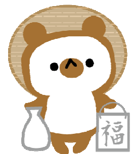
写真は撮れなかったけど、狸がいました！