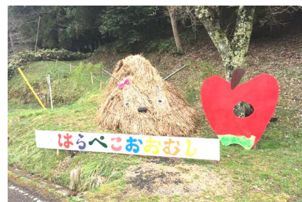
「はらぺこおおむし」くんがお出迎え

昨年に続き2度目の参加です。昨年は初めての参加でしたので、どのようなお手伝いができるのか模索状態でしたが、今年は実行委員の方々とも親しくなり、より地域の方と大虫を身近に感じる関わりをさせて頂くことができました。