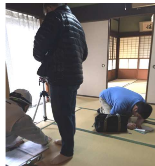
6名の鑑定士で実施しました