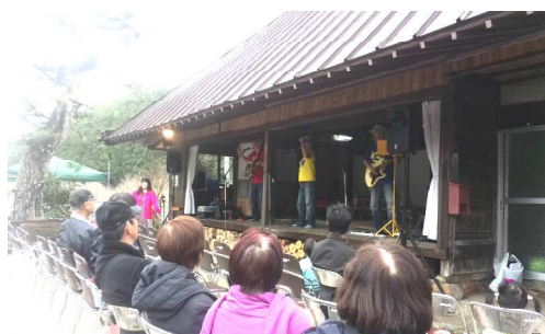
メイン会場は終始、活気にあふれていました！