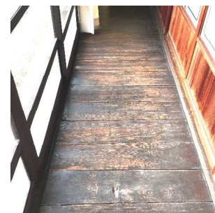
黒光りする広縁の廊下