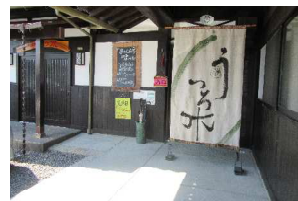
お母さんのランチはこちらから