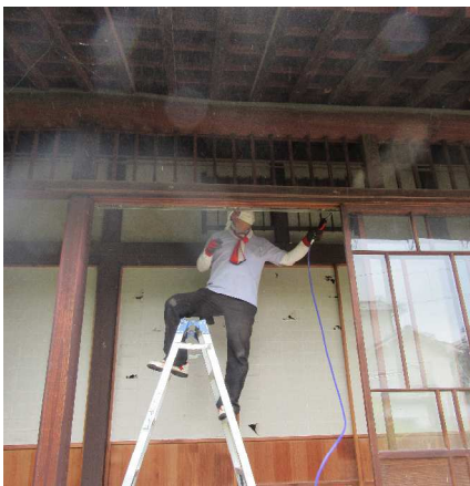
コンプレッサーで一気にホコリを落とします

2日目は、強力な助っ人メンバーが加わり、総勢7名で大掃除をしました。草刈り、拭き掃除、掃き掃除 etc 人数の力でドンドン進んでいきます！