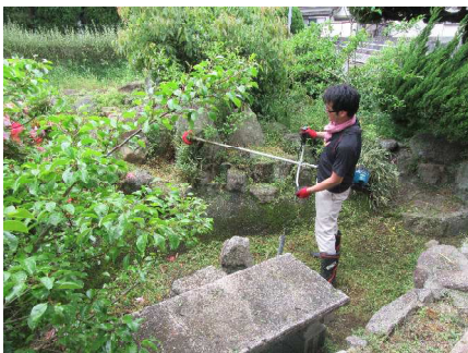
草刈りをしてスッキリ♪夏が楽しみです！