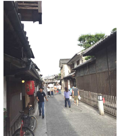
岡山県倉敷市の美観地区

倉敷の美観地区には「電柱」が存在しません。景観を保つ為、地下に埋め込まれているとのこと。徹底した街並み保存への意識に触れることができました。