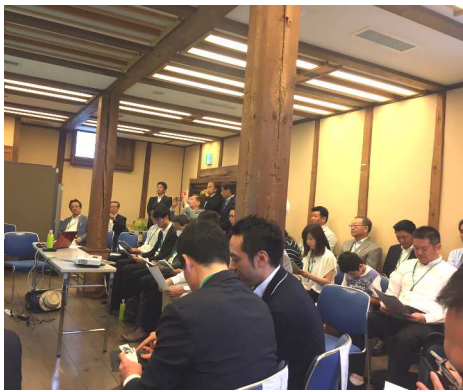
中四国の会員が集結しました(^v^)/

懇親会では、中四国の支部長や、会員さんとも交流を深めることができ、大変、有意義な時間を過ごすことができました。