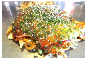
鉄板でアツアツを召し上がれ♪