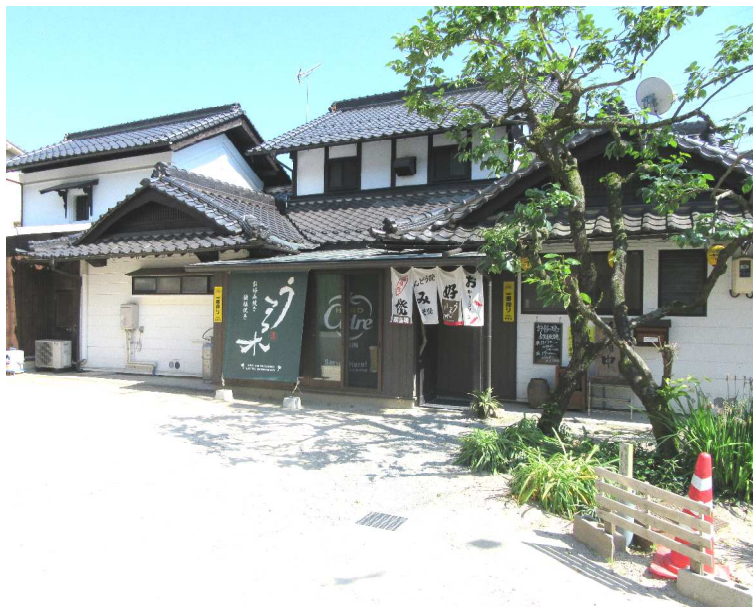
広島インターチェンジからすぐの好立地。築 100 年以上の古民家。