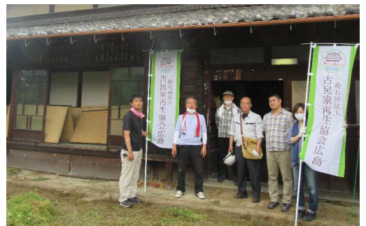
我らが古民家お掃除隊☆彡

初日は、油田&貴船チームで防虫剤を焚いて家全体の害虫駆除をし、コンプレッサーを使い梁の上のホコリを根こそぎ落としました。畳も全部あげて、2日目に向けて、最終調整をしました。