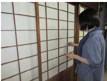
細部まで綺麗に拭き掃除をします

遊びココロのある門扉の面白さに心が躍ったり、仏間から貴重な品を発見したり、井戸水が思わぬところから噴き出して慌てたり、たぬきが住んでいることがわかったりと、皆でワイワイと楽しみながらお掃除をしました。