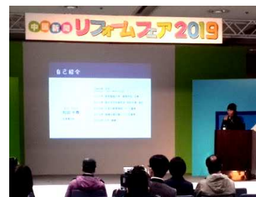
「土壁のつくる健康な暮らし」の講演

2日間参加して、当協会のブースに足を運んでいただいたお客様は、実際に木造土壁のお家に住んでいらっしゃるご年配の方が多い印象でした。