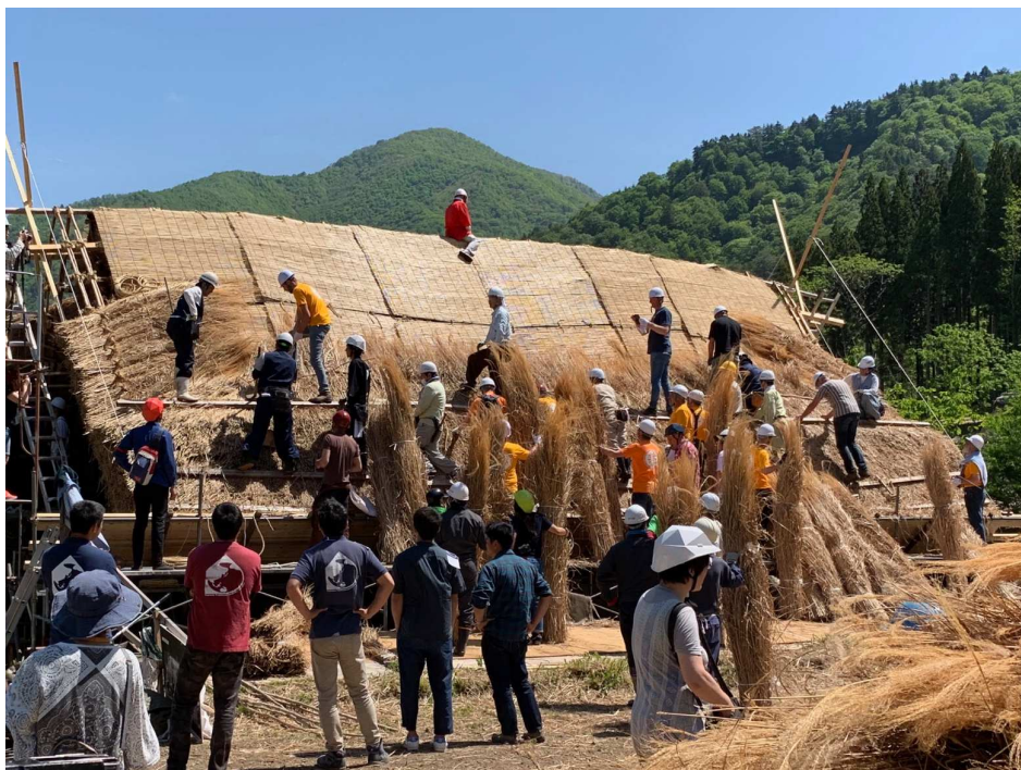
第6回国際茅葺き会議、ユイの屋根葺きワークショップ。世界の茅葺き職人が集結しました！