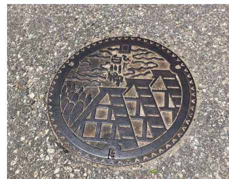
白川郷のマンホール発見(*^▽^*)

5月18日～22日 岐阜県白川村で、国際茅葺会議第6回日本大会が開催され、世界の茅葺職人の交流が図られました。