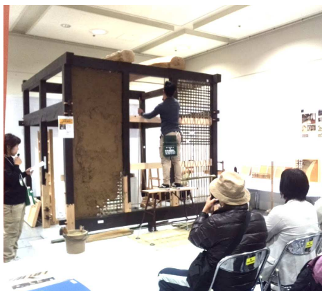
竹小舞下地・荒壁付けの実演

また、講演も土壁実演も興味を持っていらっしゃる方がほとんどで、質問内容も左官工事の希望やDIYでの壁塗り方法を知りたいなど、深い質問が多かったです。施工を懐かしんでいたりと、実際に土壁塗りを体験したかったというお声も沢山いただきました。