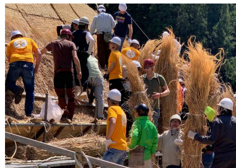
初めて見る光景に感動を覚えました！