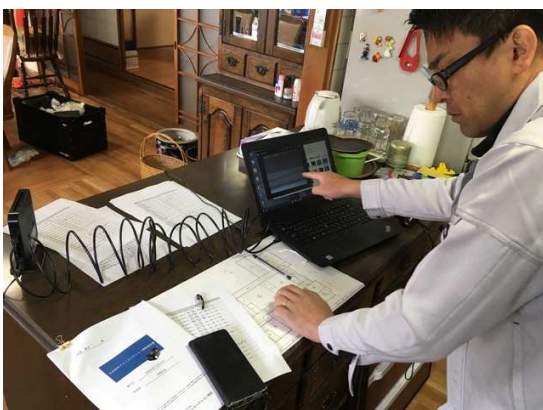
モニターで床下の状態をチェックします。