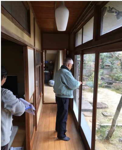
約600項目のチェックを行います

当日は、シルバー人材センターの木造空き家簡易鑑定士有資格者の方もオブザーバー参加され、熱心に鑑定の様子を見学されておられました。今後も適切な調査で一棟でも多くの古民家を次世代につなげていきたいと思えます。