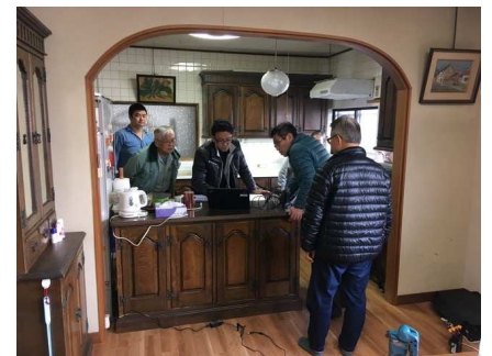
お客様と一緒にコンディションを確認します

また、耐震診断では、今まで調査してきた伝統構法とは違う波動で、在来工法独特の動きを見ることができました。