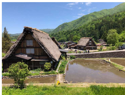
茅葺き古民家の造る世界観に魅了されました！