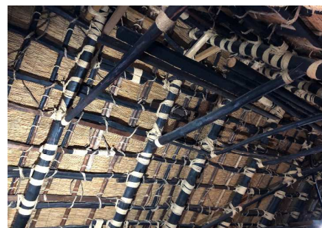
合掌屋根の内側の様子も見学しました。