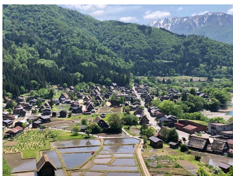
これぞ日本の原風景！素晴らしい景色でした。