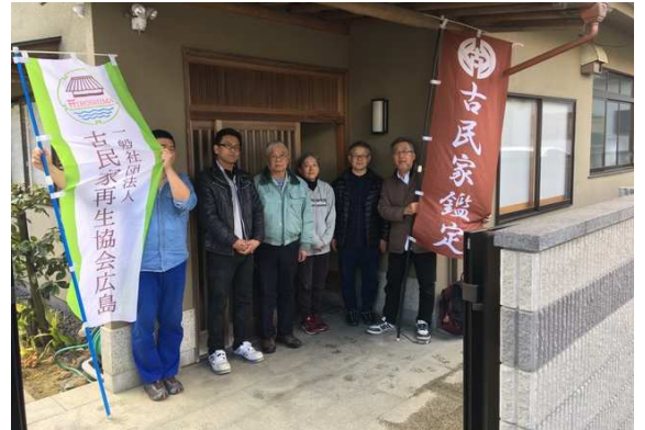
在来工法初の鑑定となりました